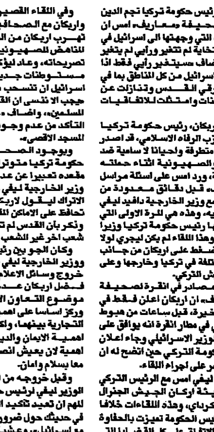
مركز غراوت (مبارك)